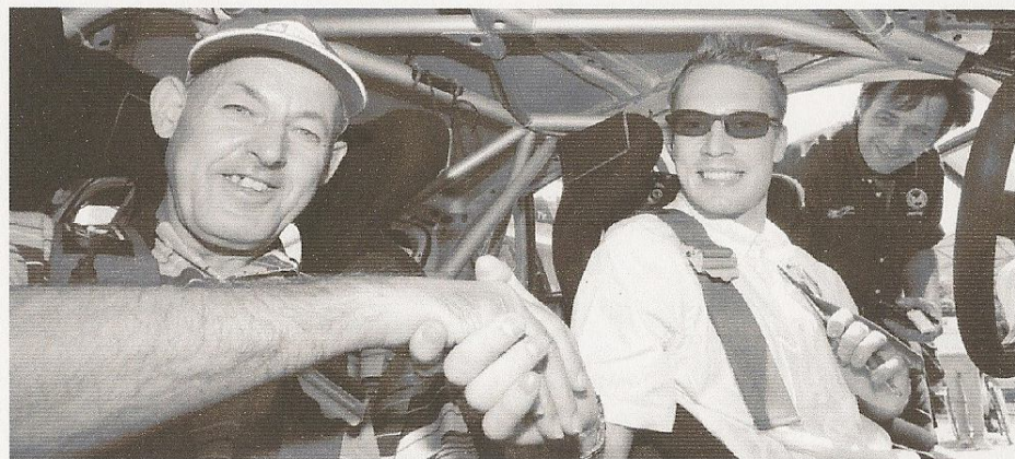
JM Latvala pronto a partire col suo nuovo navigatore